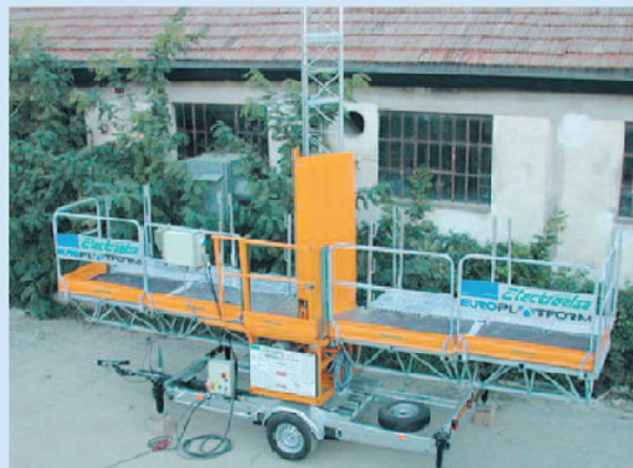
Montare - demontare, rapidă și ușor de executat