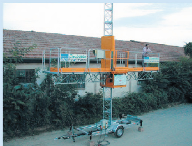
Datorita modularii elementelor componente, sistemul este extensibil atât pe verticală cât și pe orizontală.

Prin extensiile cu care este dotată platforma, profilul se poate adapta la forma exterioară a oricărei clădiri.