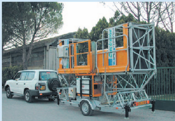
Remorcabilă cu autoturism

Alternativa ideală la nacela cu braț telescopic