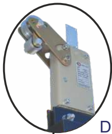
Dispozitiv de siguranta

Roti pentru mutarea platformei in cadrul santierului