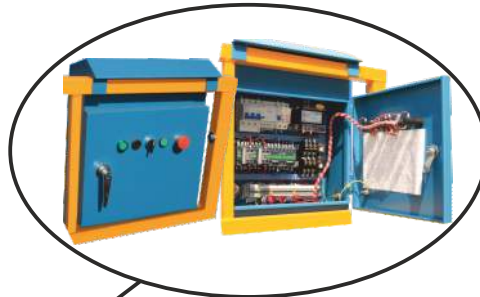
Panou de control (spate / interior)