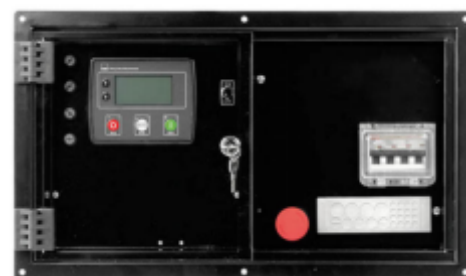
Panou comanda tip QFIA-4520 inclus in standard produs si brevetat Genmac

Protectie IP 65 Temperatura de lucru -20° + 70°C Temperatura depozitare -30°C +80°C