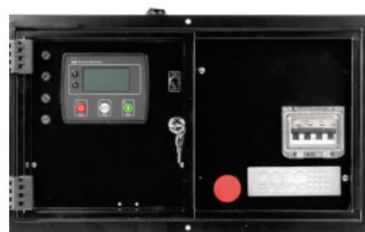
Panou comanda tip QFIA-4520