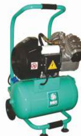
Compresor cu piston