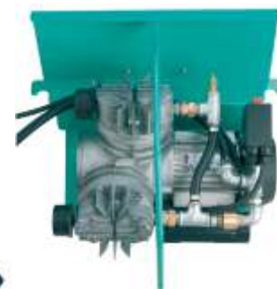
Compresor cu membrana