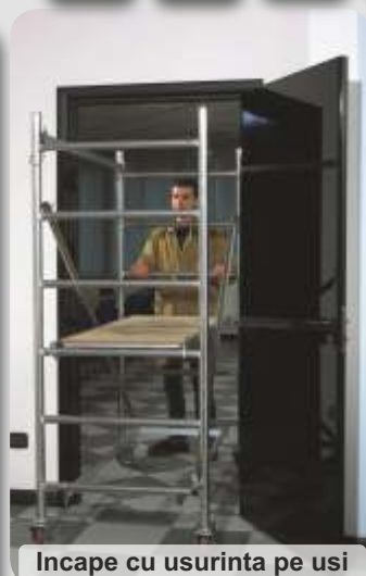
Incape cu usurinta pe usi