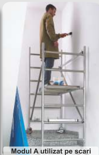
Modul A utilizat pe scari