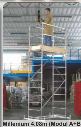
Millenium 4.08m (Modul A+B)