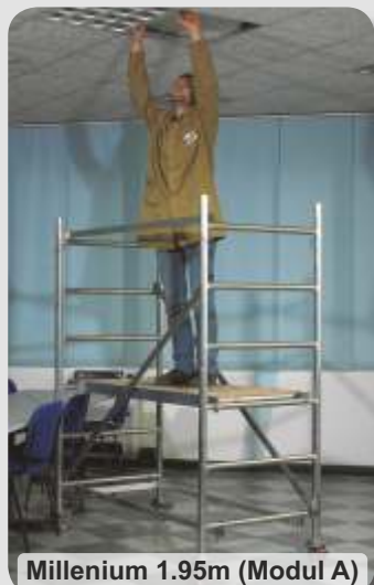
Millenium 1.95m (Modul A)